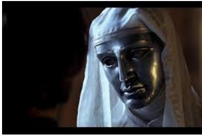
Edward Norton interpreta a Balduino en la película el reino de los cielos (2005, Ridley Scott)